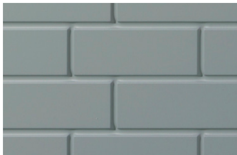
Detail hladkého provedení